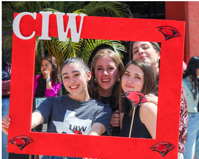
Incarnate Word Campus Mexico City

El inicio de la primavera trajo consigo el Incarnate Word Day.