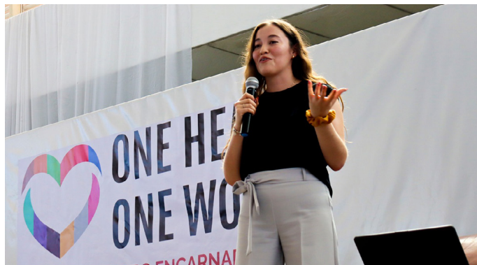
Incarnate Word Campus Bajo

A todos nuestros Cardenales: gracias por su entusiasmo, por hacer del Incarnate Word Day 2023, un espacio lleno de hermandad.